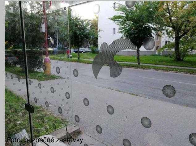
Foto: bezpečné zastávky